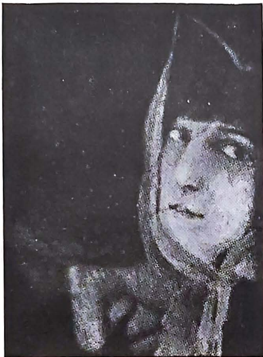
Cabeça de mulher

Porisso, a negação do Espiritismo, não representa uma legítima reacção da inteligência contra imposições arbitrárias e dogmáticas, mas uma atitude cómoda da ignorância.