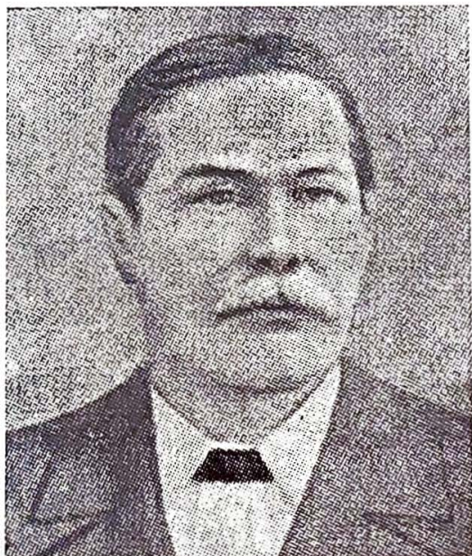
SIR CONAN DOYLE

As linhas de evolução são, certamente, muitas e variadas, ainda que orientadas na mesma finalidade de ascense e de perfectibilidade, variáveis de indivíduo para indivíduo em cada estágio planetário, consoante a predisposição das idéas, dos sentimentos e das tendências inatas adquiridas nas suas vidas passadas, incompatíveis com a hereditariedade clássica, porque são expressões psíquicas e não somáticas.