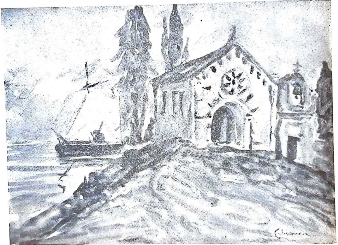
Quadro executado em transe, em 20 minutos, com os olhos vendados e na presença de varias pessoas entre as quais a escritora inglesa Barbara Musgrave (vide «Light») — Aguarela assinada por Cabianca. — Medium Luigi Bellotti.

cada, com trabalhos executados com a técnica possível, gravura a água forte, painéis executados por um novo sistema, do qual tirei patente de invenção. Simultaneamente senti-me atraído para a composição musical, para a scenografia, para a poesia, para a literatura, e, seguindo os períodos de inspiração, produzi trabalhos em todos estes campos, não com o desejo do dilettante que se detém sem nunca concluir, diante da via que o atrai, mas cuidando sempre de aprofundar nas várias matérias, de produzir bem e de efectuar aquilo que a minha mente idealizava. A persistência e a força de vontade nunca me faltaram, e, sem tréguas, tendo o domínio de várias matérias, consegui aprofundar a minha actividade nos diversos campos.