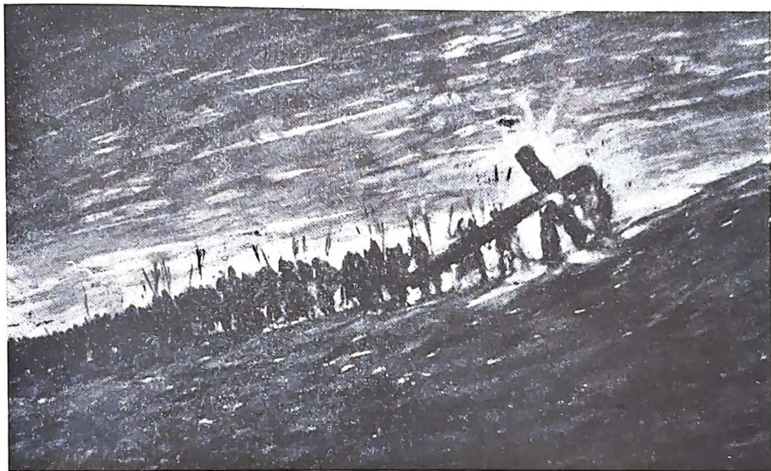
O Calvário. — Quadro executado em transe, em duas horas, com os olhos vendados, e assinado por Galtano Previati. — Dimensões 50x90 cm. — Mèdium Luigi Bellotti

escrevi alguns livros sôbre história da Arte, entre os quais a história do Capitel nos estilos de todas as nações, volume ilustrado por mim com 400 gravuras e prefaciado por personalidades de renome. Prossegui nos estudos da aèrodinâmica que sempre me tinham atraído, conseguindo fazer algumas invenções aeronáuticas que registei, baseadas nos novos princípios (asa racional, freio aéreo, etc.). Entretanto as faculdades medianímicas, psicográficas e de clarividência, começaram a desenvolver-se, e, em 1923, tive os primeiros fenómenos importantes de apport, comunicações psicografadas e os primeiros entorpecimentos de origem astral. Desde aquela época ocupei-me sempre mais de espiritualismo, de ocultismo, de sciências esotéricas, de cosmogonia, de hiperfísica, de astrologia, qui-